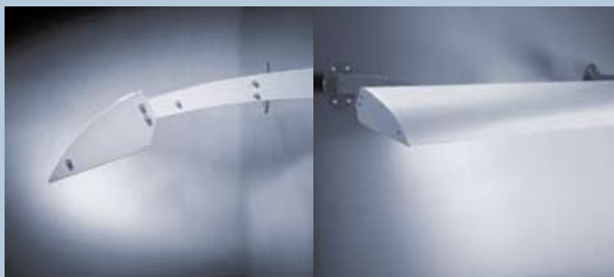
WS 4120 Wandabstand 32 cm – für Werbeflächen von 30–125 cm Höhe