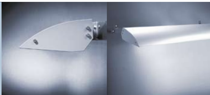
WS 4100 Wandabstand 2 cm – für Werbeflächen bis 40 cm Höhe