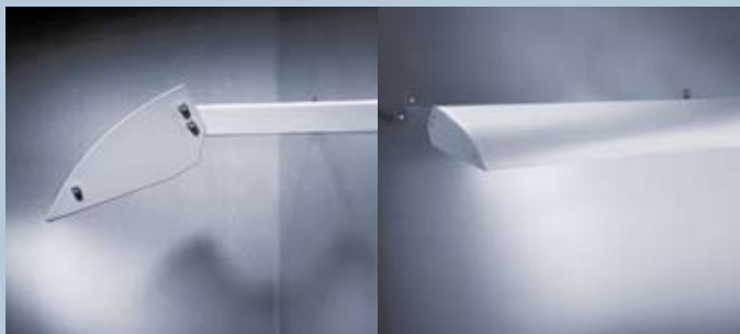
WS 4110 Wandabstand 28 cm – für Werbeflächen von 30–100 cm Höhe