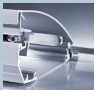
WS 4150 Profilverbinder