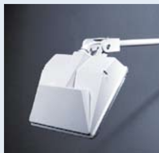
WS 4004-W/WS 4005-W