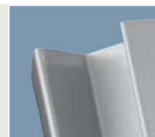
Monolith Reel Steel 2 gewölbt (Detail)