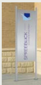
REAL STEEL FREILANDSCHILD 1, HÖHE 150 CM für einseitige Beschriftung, Standfüße zum Aufschrauben*

Beschriftung mit 3M-Hochleistungsfolie oder Digitaldruck auf Anfrage; * (EB) zum Einbetonieren Pfosten 60 cm länger