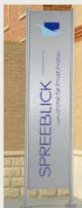
REAL STEEL FREILANDSCHILD 1, HÖHE 200 CM für einseitige Beschriftung, Standfüße zum Aufschrauben*

Beschriftung mit 3M-Hochleistungsfolie oder Digitaldruck auf Anfrage; * (EB) zum Einbetonieren Pfosten 60 cm länger