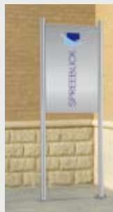
REAL STEEL FREILANDSCHILD 1, HÖHE 125 CM für einseitige Beschriftung, Standfüße zum Aufschrauben*